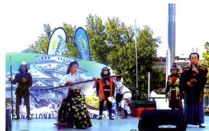
パースジャパンフェスティバル2016会場風景 とき:平成28年2月27日 ところ:西オーストラリア州都パース